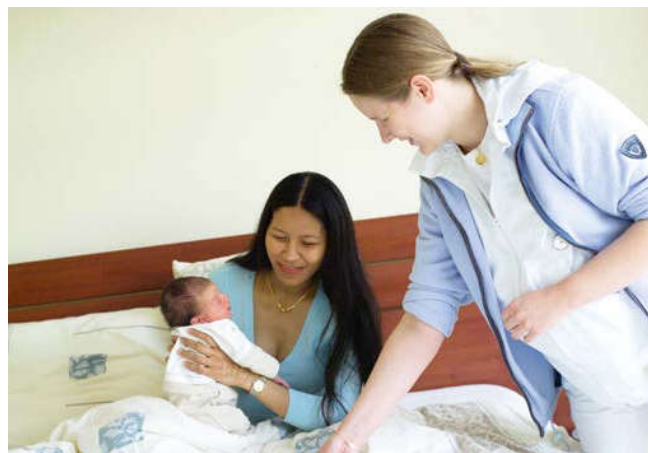
De kraamverzorgster voert elke dag controles uit bij u en uw baby, zodat een eventuele infectie tijdig wordt herkend.

Ja, het geven van borstvoeding is onschadelijk voor het kind en bevordert het genezingsproces. Overleg met uw verloskundige of huisarts als de klachten aanhouden. Heeft u een borstontsteking en daarnaast ook koorts? Neem dan contact op met uw huisarts.