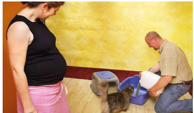
In uitwerpselen van (vooral jonge) katten kan toxoplasma zitten. Verschoon daarom niet zelf de kattenbak.

Dieren op de (kinder)boerderij kunnen ziekteverwekkers bij zich dragen die ook voor mensen gevaarlijk kunnen zijn. Raak dieren, hooi, stro en mest bij voorkeur zo min mogelijk aan en was uw handen met zeep en veel water na contact met dieren. Eet niet tussen de dieren en eet geen voedsel dat op de grond is gevallen. Veeg uw voeten bij vertrek zodat u geen mest onder uw schoenen mee naar huis neemt.